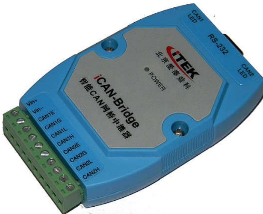
图 1.1 iCAN-Bridge 智能 CAN 网桥中继器外观图