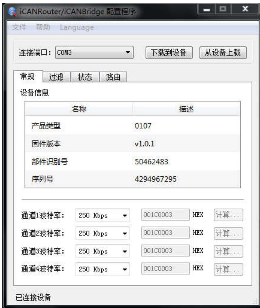
图 3.2 设置波特率

配置软件已经预置了若干个波特率，其中一些是符合 CiA 推荐的波特率要求的。但有些预置的波特率并不一定能满足实际应用场合的要求。因此配置软件提供给用户自定义波特率的功能。波特率有很多元素是用户可定义的。iCAN-Bridge 使用一个 32 位的数值描述整个波特率，其结构如下所示。