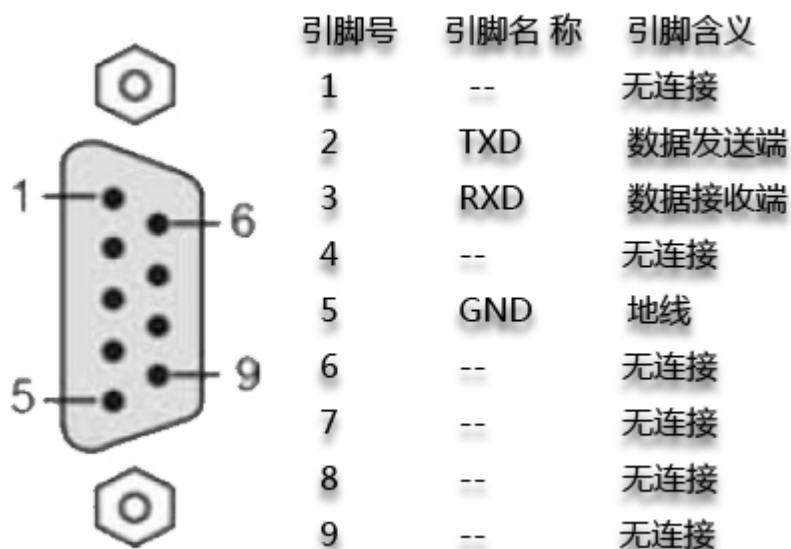
图 2.1 RS232 信号定义

iCAN-Bridge 通过 RS232 接口来配置。图 2-1 显示了 iCAN-Bridge 上的 RS232 接口的引脚定义。