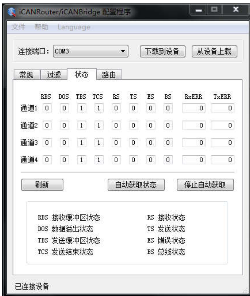
图 3.4 CAN 总线状态监测

可以通过配置程序实时监视 iCAN-Bridge 各个通道的状态。在“状态”标签下点击刷新按钮，软件界面上即可显示设备各个通道的工作情况，如图 3.4 所示。下表列出了各个参数的具体含义。