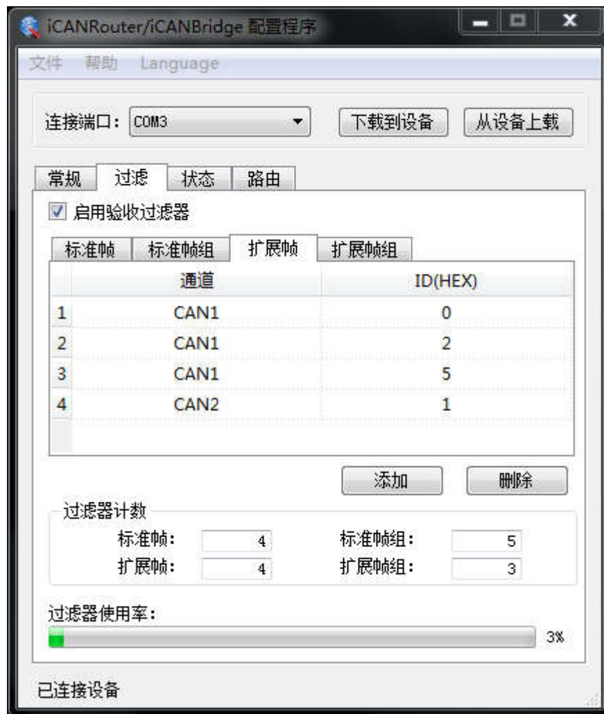
图 3.3 设置接收过滤器

iCAN-Bridge 有一个强大的消息过滤器。该滤波器有 1024 个单元，可容纳 1024 个标准标识符或 512 个扩展标识符或两种类型混合的标识符。在“过滤”选项卡中把过滤器的类型分为 4 种：标准帧标识符、标准帧组标识符、扩展帧标识符和扩展帧组标识符。其中组标识符指的是一段连续的标识符。在配置界面上点击的选项卡，可在下面的表格中显示对应的过滤器的详细信息，同时更改滤波器的内容。如图 3.3 所示。